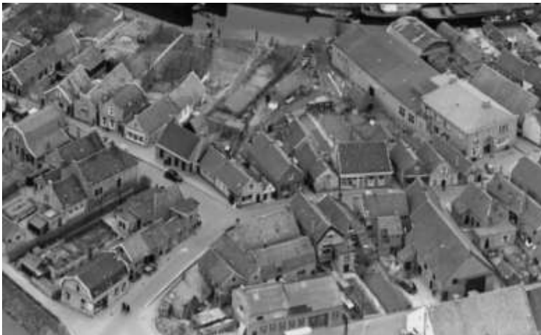
Foto 2. Luchtfoto 1955.