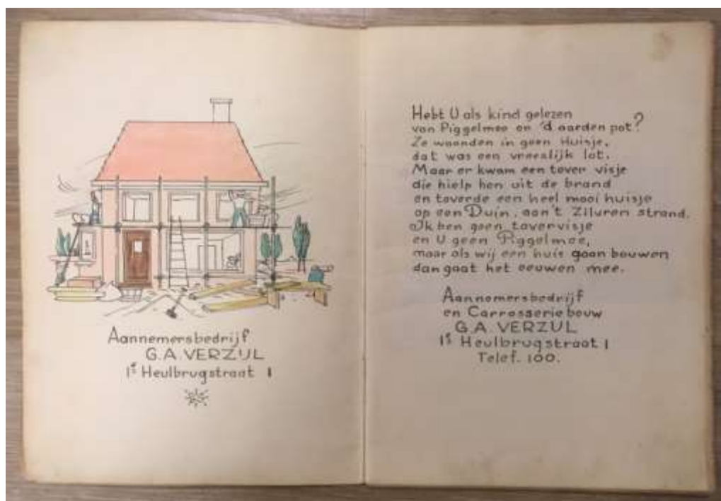
Foto 1 (Boven) Reclame voor Aannemersbedrijf en carrosseriebouw G.A. Verzijl.

Vorkaft, schutblad en de eerste bladzijden met de reclame voor H. van Bodegom zijn in de vorige nieuwsbrief afgebeeld. De volgende bladzijde gaat over G.A. Verzijl.