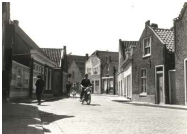
Foto 7. Het begin van de Voorstraat.

Links op foto 7 bevinden zich de oneven nummers. Daar is (vanaf de linkerkant van de foto) als eerste een grijs/witte schutting te zien. Daarachter stonden de huizen aan het Erfslop. (N.B. dat is niet het huidige Erfslop). Het volgende pand is nummer 7, de winkel en het woonhuis van sigarenmagazijn Fa. Huijsman. De vitrine in de grijs/witte schutting was van deze firma. Het volgende pand is de winkel van Constandse.